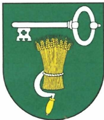
Príloha 1: erb obce